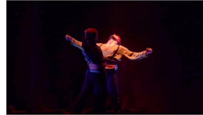
LA MUERTE DEL TUERTO Segundo Acto

José llega al puerto de Gibraltar buscando a Carmen, haciéndose pasar por un pobre comerciante. Tras mezclarse entre los trabajadores y participar del floclor y costumbrismo andaluz, entran en escena Carmen del brazo de un Lord Inglés, al que ella está utilizando para sus negocios. Tras encontrarse ambos, trazan un plan para robar y matar a este. Pero para sorpresa de José, el verdadero plan de Carmen también incluye que él mate al "Tuerto" para así poder ser por fin marido y mujer por la ley gitana.