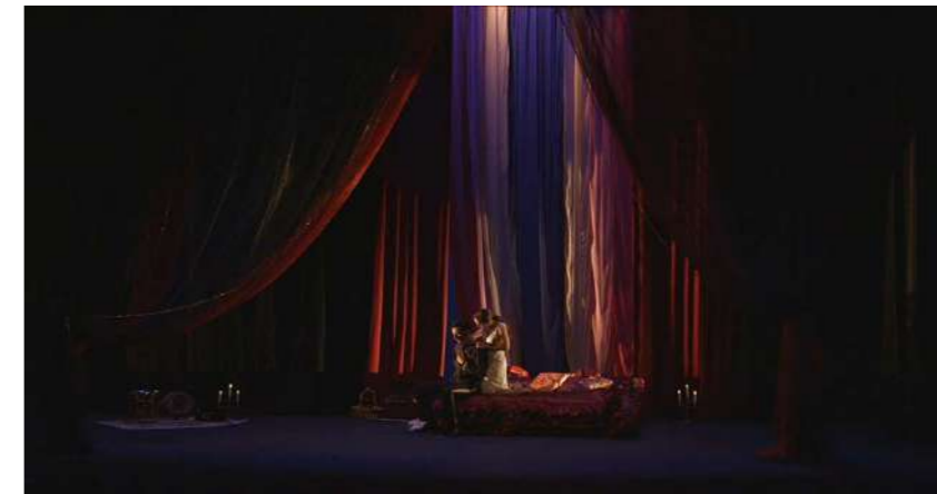
● Escenografía "La casa de la Dorotea"

En la obertura, Fajardo, ha situado al espíritu de Carmen en un espacio onírico, donde su alma, llena de fuerza y sangre, se va a enfrentar a sus tinieblas en blanco y negro, a todas las personas que ha manipulado en su vida y las que tiene que rendir cuentas, transportándonos a continuación a la Sevilla del Siglo de Oro más costumbrista