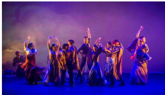
CAMPAMENTO DE LOS BANDOLEROS Segundo Acto

Una noche mientras espera aparece Carmen con el capitán. Éste, cegado por los celos, agarra su espada y se lanza contra el militar. La pelea acabara con el capitán muerto y José huyendo de su vida como militar y escapando a las montañas como un vil bandolero.