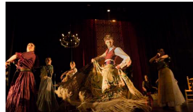
TABERNA EN GRANADA Segundo Acto

Tras este pasaje, José entra en cólera y enloquece de celos. una vez en casa pierde los nervios y por primera vez pega a Carmen... esto desemboca en el fin de su relación. José cada vez mas obsesionado con los celos y Carmen cada vez mas segura de que quiere ser libre.