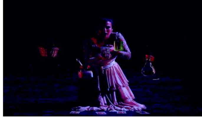
CASA DE CARMEN Segundo Acto

Al llegar ve a Lucas matando su primer toro entre vítores y aplausos; pero para desgracia del público, será corneado por el segundo toro. Carmen acude a consolar a su amante herido y una vez más, José lo observa todo; pero cuando quiere llegar hasta Carmen ésta se pierde entre el tumulto generado por la cogida de Lucas.