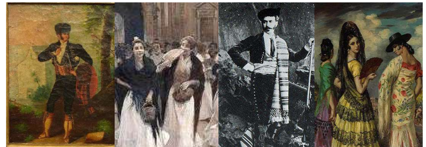
Imágenes de cuadros y grabados de la época que han servido de inspiración para la elaboración del vestuario de "Carmen de Mérimée"