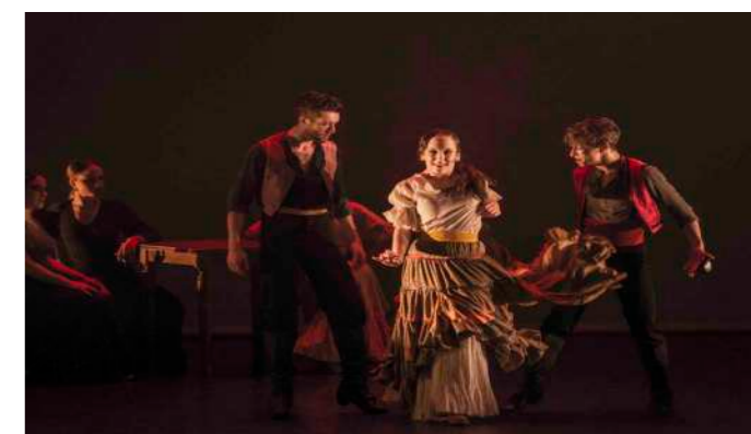
EL MERCADO DE SEVILLA Primer Acto

A modo de presentación veros una imagen del Carmen, que tras morir debe enfrentarse a los espectros de todos los hombres a los que engañó en vida. Entre tinieblas veremos claramente la desesperación de Carmen al enfrentarse al destino que ella misma escogió.