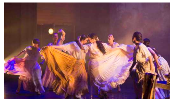
INTERIOR DE LA TABACALERA Primer Acto

Comienza la escena mostrando una plaza del mercado de Sevilla a las puertas de la Real Fabrica de Tabacos. Mientras suena la Aragonesa de Bizet se nos presenta al pueblo, a las cigarreras y a los personajes de Don José y Carmen, que tendrán su primer encuentro.