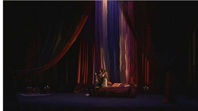
CASA DE LA VIEJA DOROTEA Primer Acto

Al final de la escena Carmen, al marcharse de allí, citará a José para tener su primer encuentro.