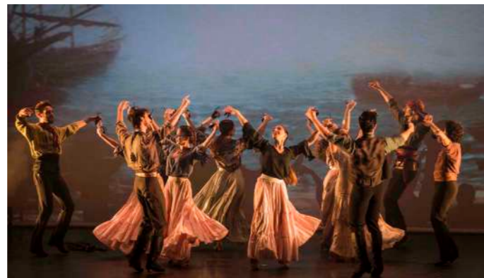
GIBRALTAR Segundo Acto

Una persecución en plena noche entre los bandoleros y la guardia nos presenta las montañas de Ronda y el escondite de los forajidos compañeros de Carmen, a los que se unió José. Carmen presenta a su marido "El Tuerto" que a partir de ahora será el rival de José por las atenciones de Carmen. Durante la fiesta de bienvenida, la gitana jugará a un continuo triángulo amoroso en sus danzas y toques de castañuelas entre su marido y su amante. Al amanecer, y tras despedirse únicamente de José y mientras el resto duerme, ella marchará a Gibraltar para buscar otra víctima de sus engaños.