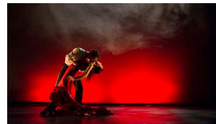
LA CARCEL Primer Acto

Ella conseguirá engatusar a José para ser liberada, lo que le costará al militar la degradación y entrada en el calabozo.