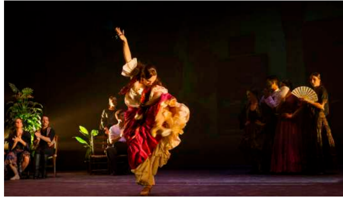
FIESTA DEL CORONEL Primer Acto

Tras salir de prisión José es puesto a guardar la casa de uno de sus superiores. Se celebra el cumpleaños del Capitán al que Carmen ha sido invitada como bailarina junto con la vieja Dorotea y un pequeño grupo de gitanos. En su danza ella no cesará de mirar a José, quien aumentará así su obsesión por ella.