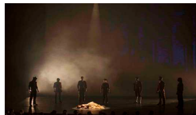
OBERTURA Primer Acto

A modo de presentación veros una imagen del Carmen, que tras morir debe enfrentarse a los espectros de todos los hombres a los que engañó en vida. Entre tinieblas veremos claramente la desesperación de Carmen al enfrentarse al destino que ella misma escogió.