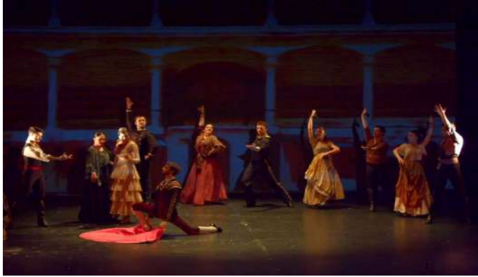
PLAZA DE TOROS DE CÓRDOBA Segundo Acto

El deseo de libertad lleva a la gitana a buscar mas encuentros con Lucas hasta el punto de llegar a enamorarse de él.